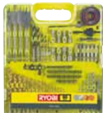
RAK 31 G 31 dílná souprava příslušenství