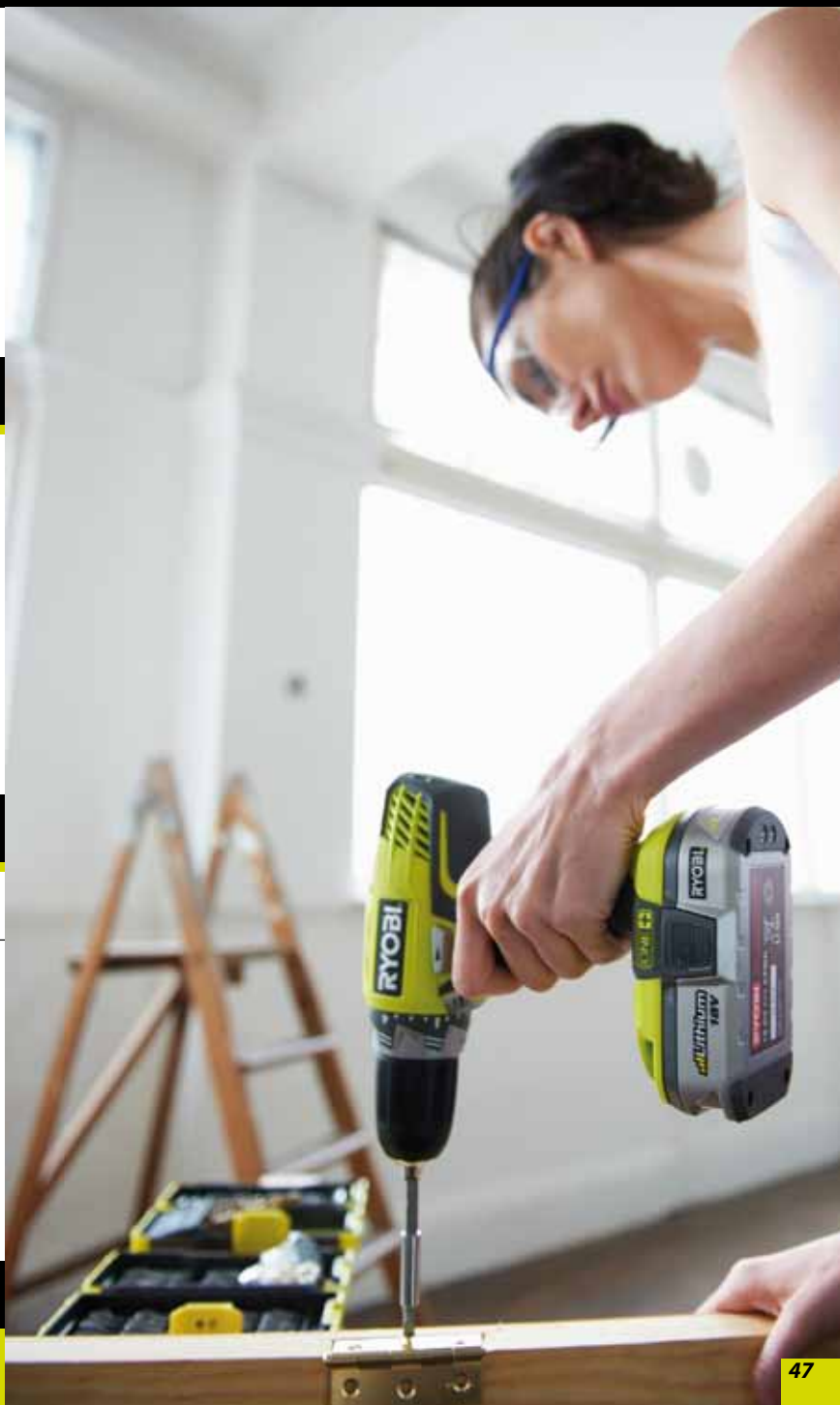
RTC 0022 B 22 dílná souprava příslušenství se sklíčidlem Quickchange™