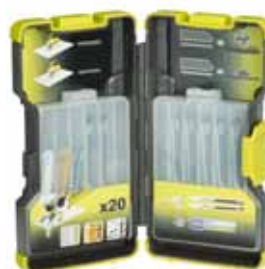
RAK 06 RB 6 ks sada plátek do šavlových pil