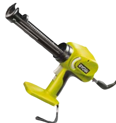
CNS 1801 MHG 18V Akku sponkovačka