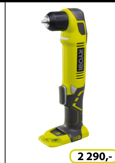
RCD 1802 M 18V 2-rychlostní aku vrtací šroubovák