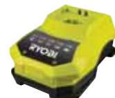
Rychlonabíječka 14,4 V: BCL 14181 H – 45 min. až 1h univerzální nabíječka pro lithiové i NiCd baterie, 14,4V a 18V, cena 890 Kč