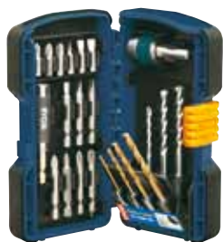
RAK 90 G 90 dílná souprava příslušenství