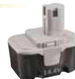
NiCd baterie 14,4 V: BPP 1417 – 14,4 V, 1,7 Ah, cena 1 490 Kč