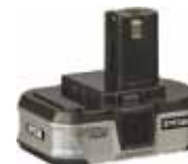
Lithiové baterie 14,4V: BPL 1414 – 14,4V, 1,4 Ah, cena 1 390 Kč